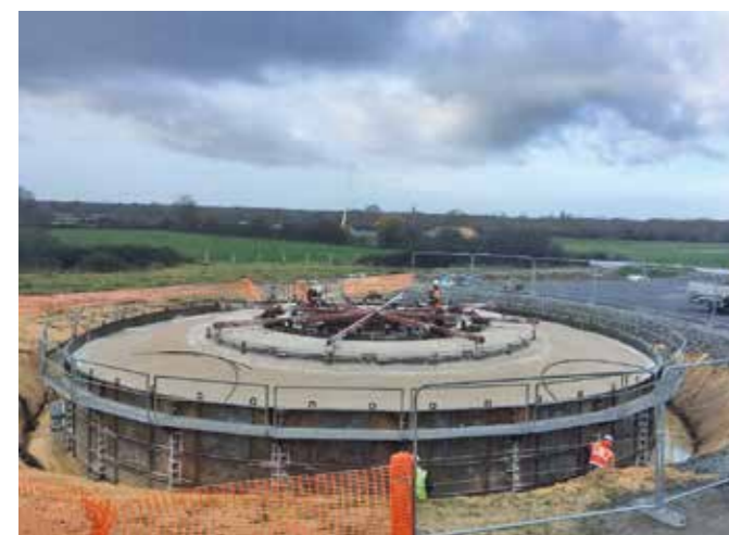
Fondation de l'éolienne n°2

Sur le site de la Lande du Moulin du Breil, les travaux du parc éolien se poursuivent. Les accès au site et l'aménagement des plateformes ont été réalisés durant l'automne. Le coulage du béton des fondations, actuellement en cours, se prolongera durant le premier trimestre 2022. Ensuite, les éléments des mâts seront livrés sur le site et assemblés durant le printemps.