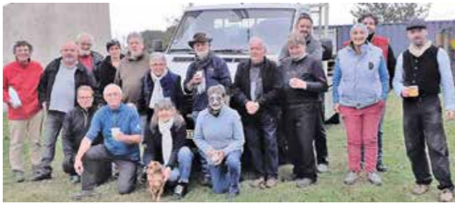
Le troc plantes du 24 octobre dernier

L'association a dû faire face aux travaux du site de la Ducherai ainsi qu'aux contraintes imposées par la crise sanitaire.