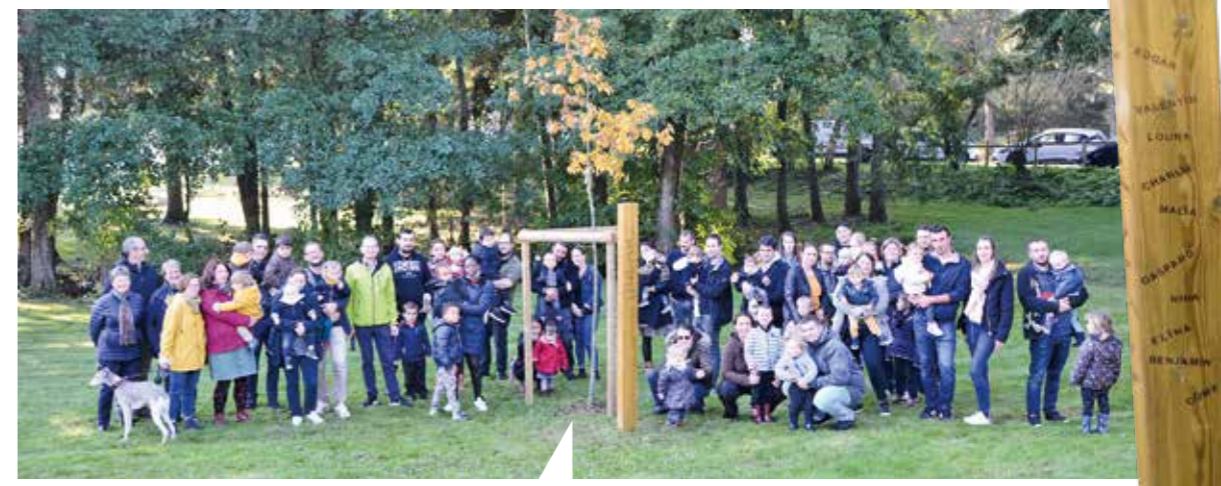
Inauguration, le 16 octobre, de l'arbre des naissances pour les enfants nés en 2020