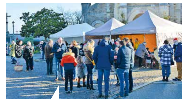
Le 18 décembre, un marché automne-hiver animé, avec une belle fréquentation