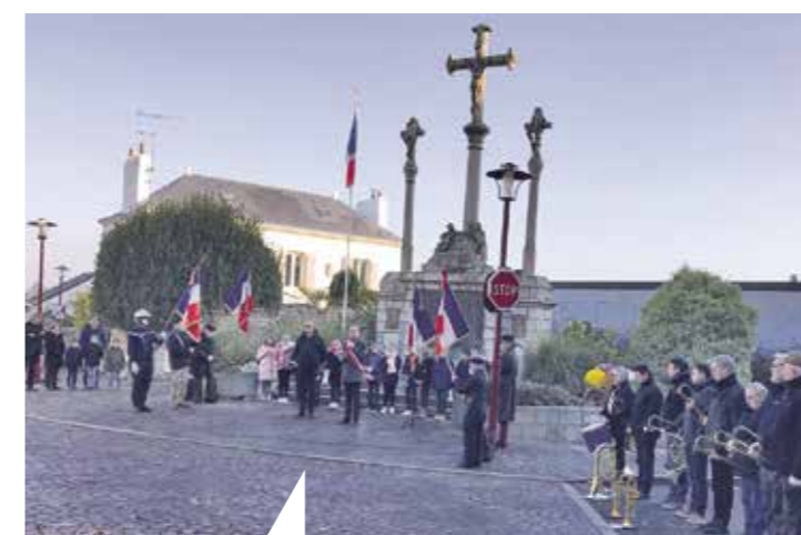
Commémoration du 11 novembre, avec la participation des enfants des écoles