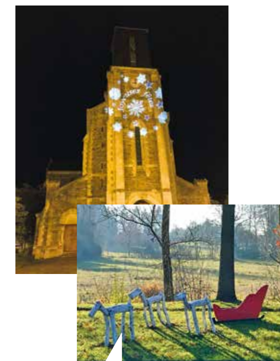
De nouvelles idées pour Noël