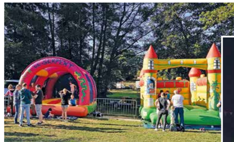
Des structures gonflables toujours appréciées par les enfants