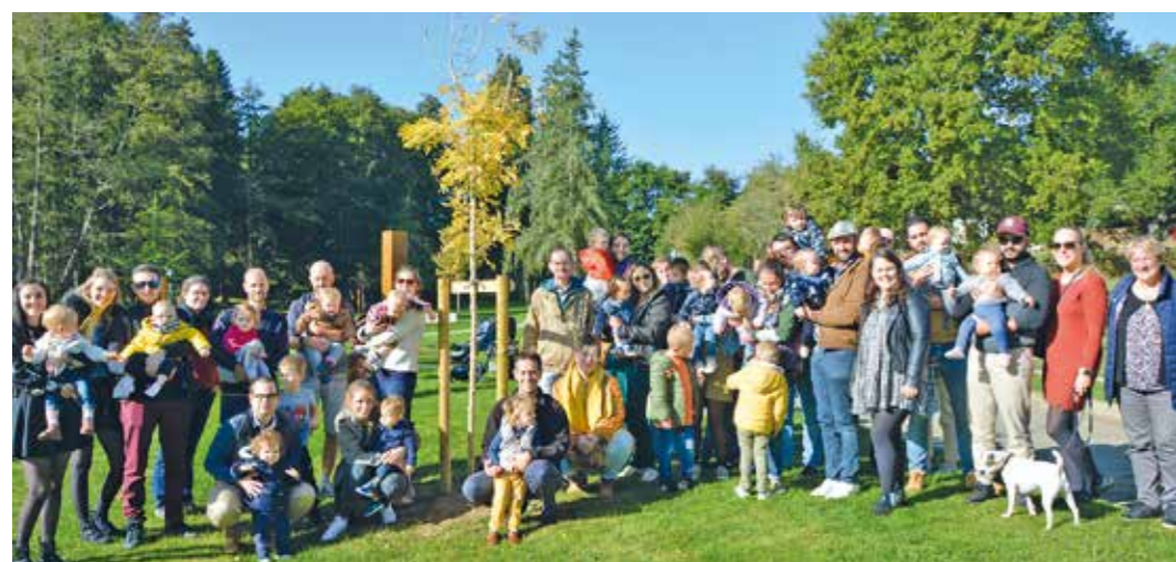
8 octobre, un arbre planté en l'honneur des enfants nés en 2021