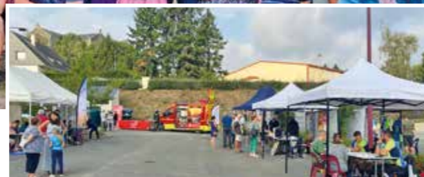
Forum des associations du 3 septembre, une trentaine d'associations présentes