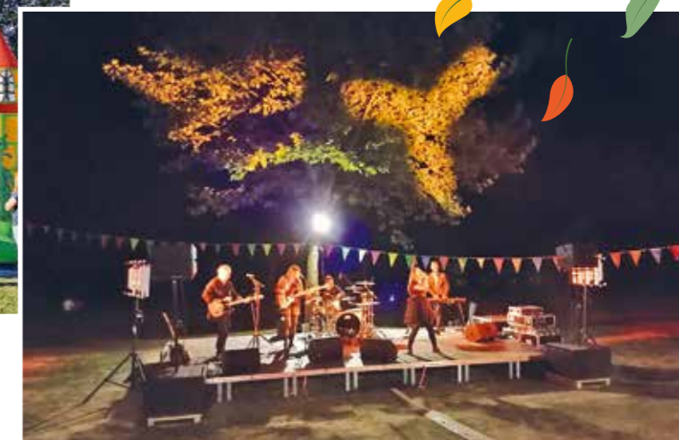
Un beau concert du groupe Louie Louie pour terminer la soirée

Festival Flân'Art des 16, 17 et 18 septembre : une édition diversifiée avec des animations bien suivies !