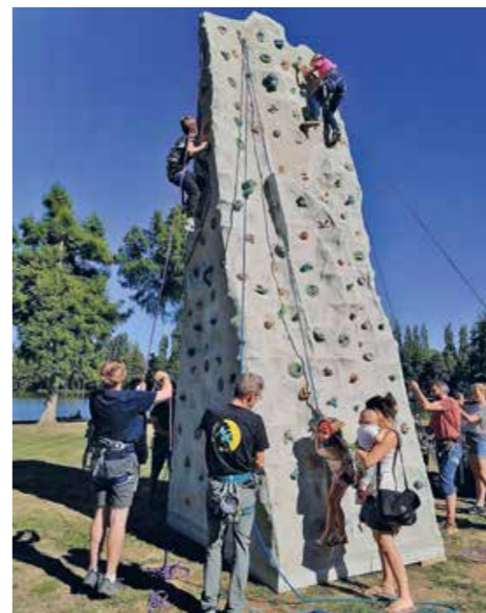
Gros succès pour le mur d'escalade installé pour le seconde année

Festival Flân'Art des 16, 17 et 18 septembre : une édition diversifiée avec des animations bien suivies !