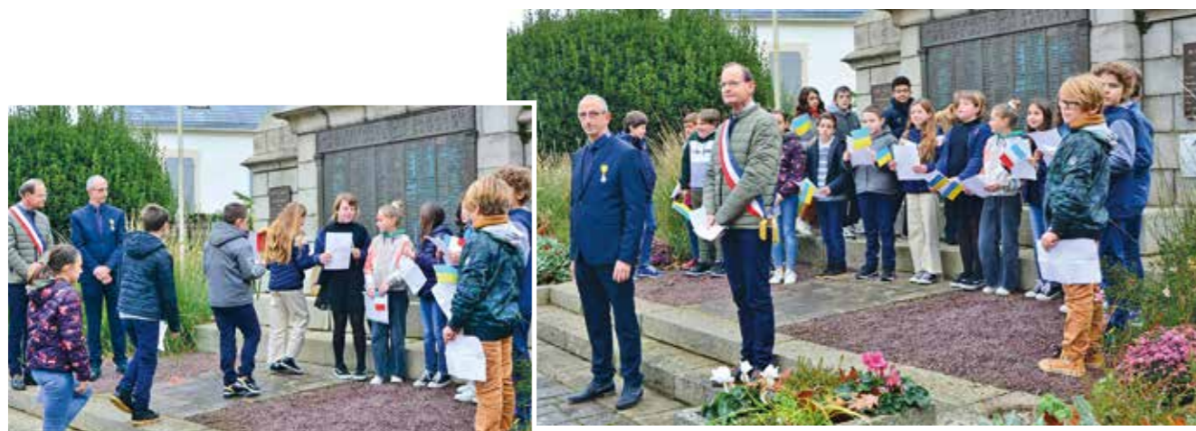
Commemoration du 11 novembre, avec les enfants de CM2 des écoles