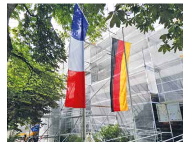
La mairie de Biessenhofen en travaux, aux couleurs franco-allemandes

La bonne humeur, les chants et l'humour du chauffeur de bus marqueront cette belle édition 2022.