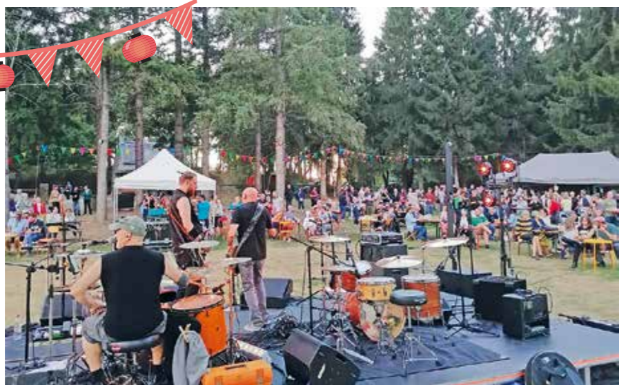
Groupe Royal trip

Grosse affluence au rendez-vous du lac du 26 août !