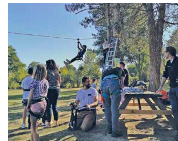
Une première, une tyrolienne a été installée sur le site du lac