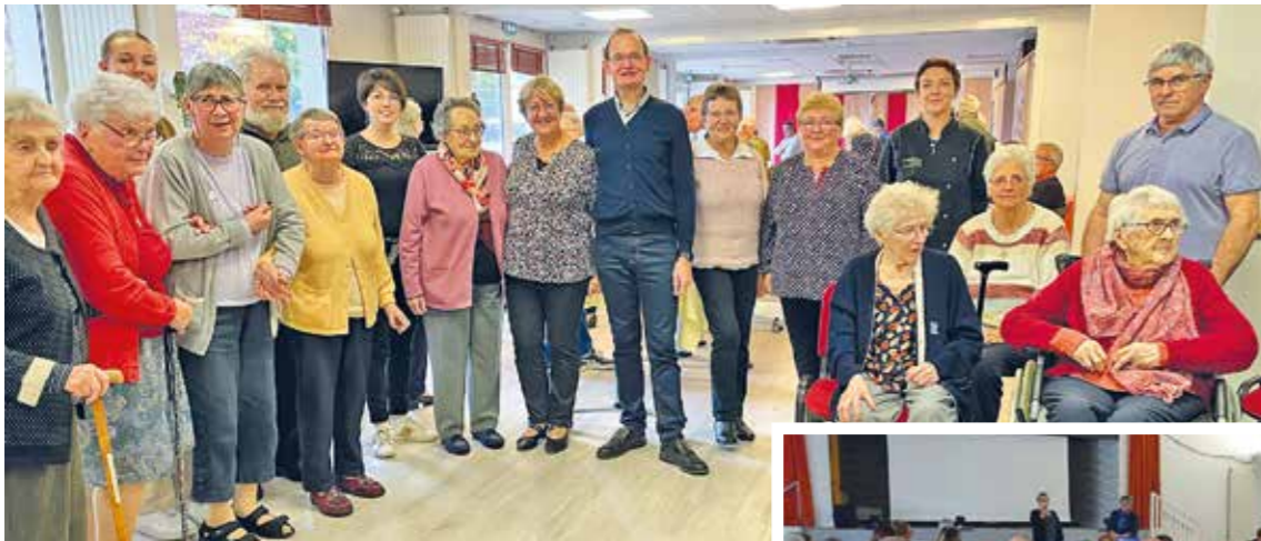
Après le partage du goûter à la résidence Saint-Martin, le 14 octobre

Après la séance de cinéma du 4 octobre, le spectacle de chansons du 8 octobre, le forum sur les services à disposition des aînés du 12 octobre a été bien apprécié. Cette semaine bleue 2022 s'est ensuite terminée par le goûter spectacle du 13 octobre (en partenariat avec la CCES) et le moment convivial proposé par la Résidence Saint-Martin le 14 octobre.