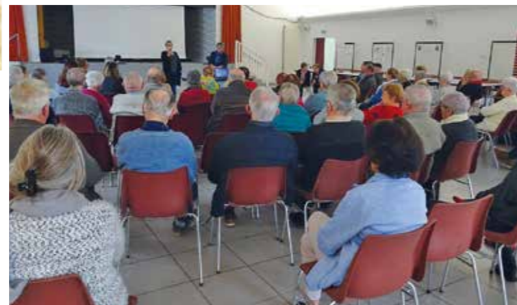
Forum des services aux aînés, le 12 octobre