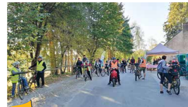
Départ de la première randonnée familiale sur la boucle de Zéphyr