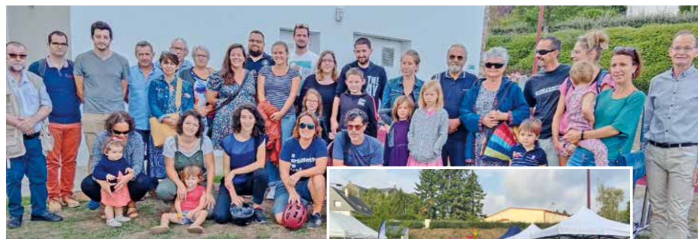
Accueil des nouveaux habitants, le 3 septembre