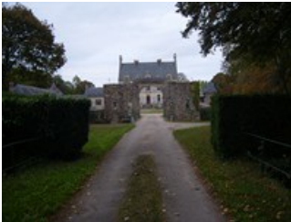
Château privé de Coislin