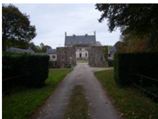
Château de Coislin