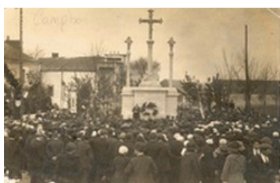
Monument aux morts