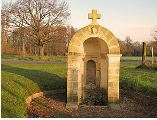
Fontaine Saint Victor