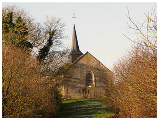
Chapelle Sainte Barbe