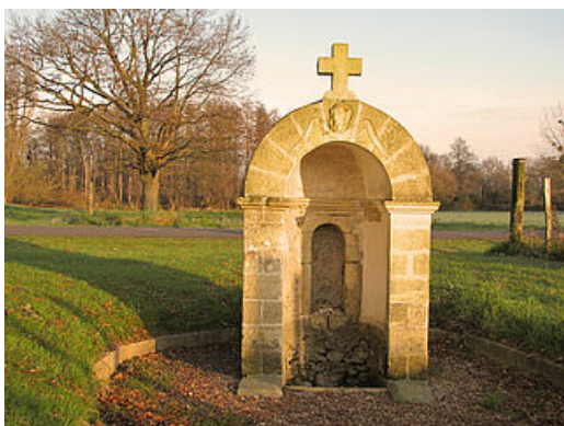
La Fontaine Saint-Victor